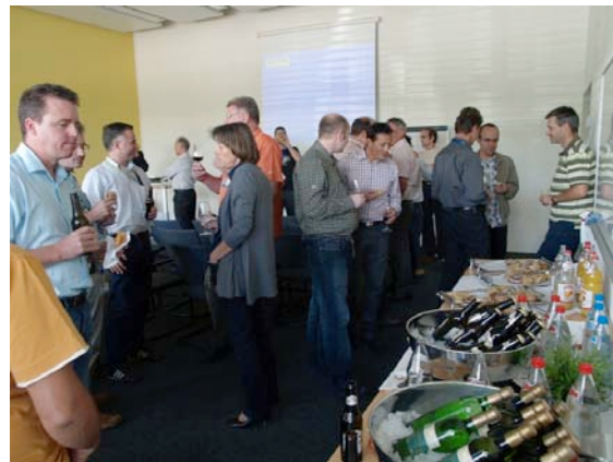
Apéro nach der Fachveranstaltung EKF

Viel erfreulicher waren dafür das gelungene FDACH-Treffen in Gersau, die Fachveranstaltung EKF und der Austausch mit skyguide. Zusammen mit den Verbänden der Flugverkehrsleiter und den AOT-Sozialpartnern findet mittlerweile ein regelmässiger Austausch mit der skyguide-Geschäftsleitung statt. Die Teilnehmer werden vorab transparent informiert und haben Gelegenheit sich einzubringen. Dieser Austausch geschieht zweimal im Jahr. Lokal (ZRH und GVA) gibt es weitere Meetings mit dem Ziel, einen besseren Austausch zwischen Basis und Linie zu fördern (vor allem für Operations). Der Austausch ist aus unserer Sicht noch lange nicht auf dem gewünschten Niveau, speziell in den Themen welche uns direkt betreffen resp. im „Bereich Technik“ gibt es noch erhebliches Verbesserungspotential.